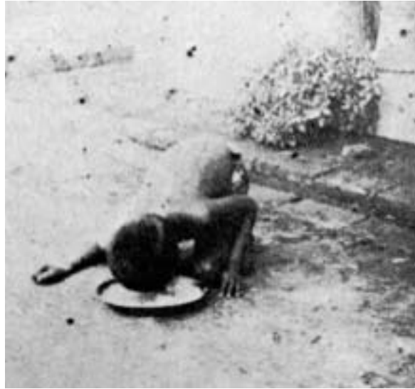
Kamala (capturée en 1920 et morte en 1929) lapant des aliments.