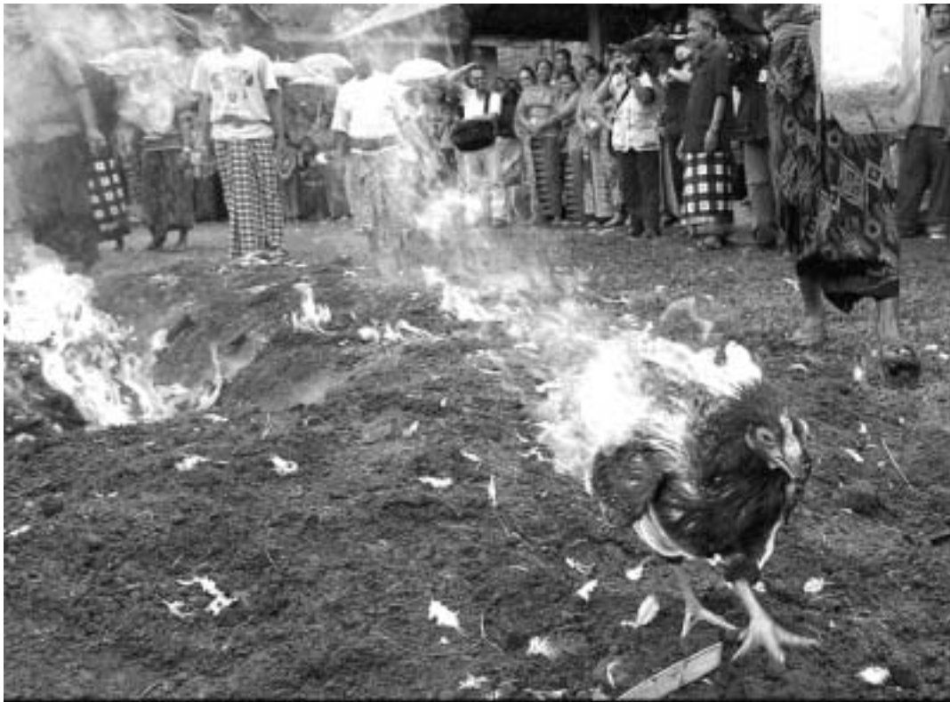
Poules et poulets brûlés vifs en Asie pour éviter une humanisation de l'épidémie de grippe aviaire.