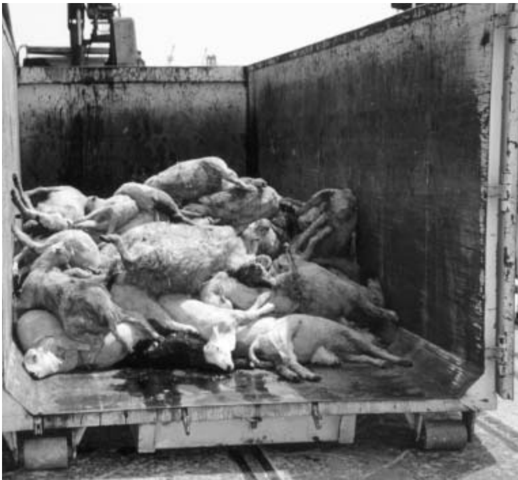
Brebis mortes avant d'arriver à leur destination, l'abattoir.