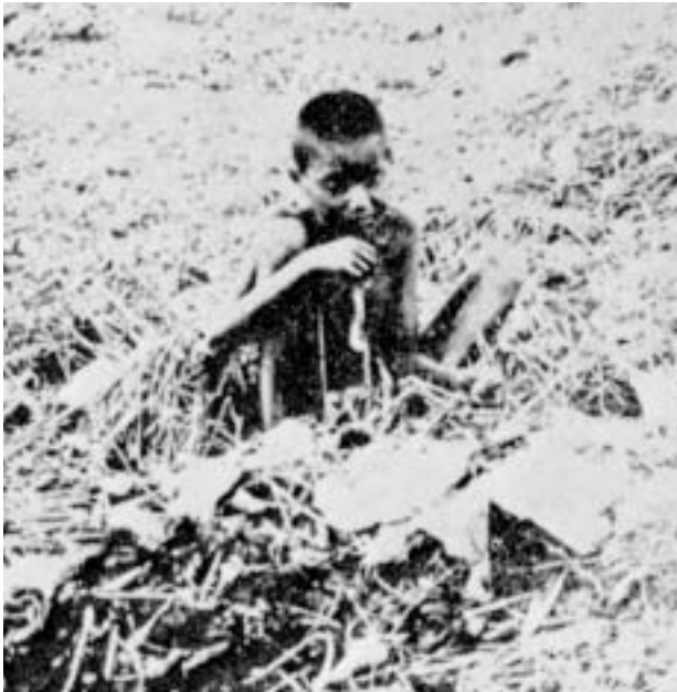
Kamala mangeant les entrailles d'un poulet.

Dans les années 1920, Amala et Kamala, élevées par des loups en Inde, ont vécu, bien qu'humaines, à la façon des animaux, ébréchant ainsi involontairement la frontière humain-animal. Leur comportement étant animal, le regard porté sur les enfants sauvages ressemble beaucoup à celui porté sur les animaux, en particulier au sujet de la certitude qu'ils ne souffrent pas. Mais après sa capture et sa domestication, la sensibilité à la douleur de Victor, l'enfant sauvage de l'Aveyron, se révéla identique à celle des autres humains.